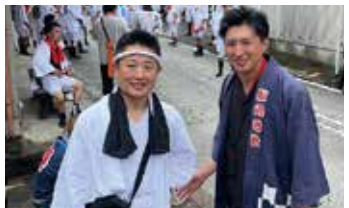
四日市の天神祭り