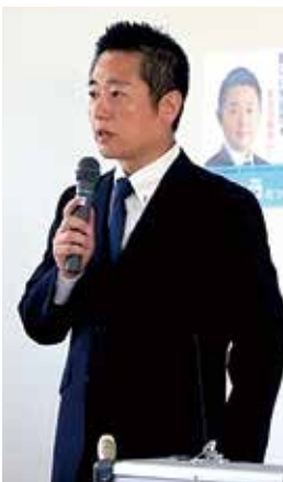
出馬表明の記者会見