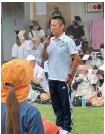
幼稚園の運動会で