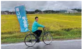
自転車で訪ねています